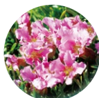
サボナリアプミラ