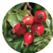
カニナバラ 果実エキス

※1:3つの植物幹細胞由来保湿成分(アルガニアスピノサカルス培養エキス、リョクトウ成長点細胞培養エキス、ロドデンドロンフェルギネウム葉培養細胞エキス:保湿成分)をプラチナ(白金:保湿成分)に被覆させた成分です ※2:保湿成分