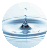
プラセンタエキス