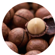
マカデミア 種子油